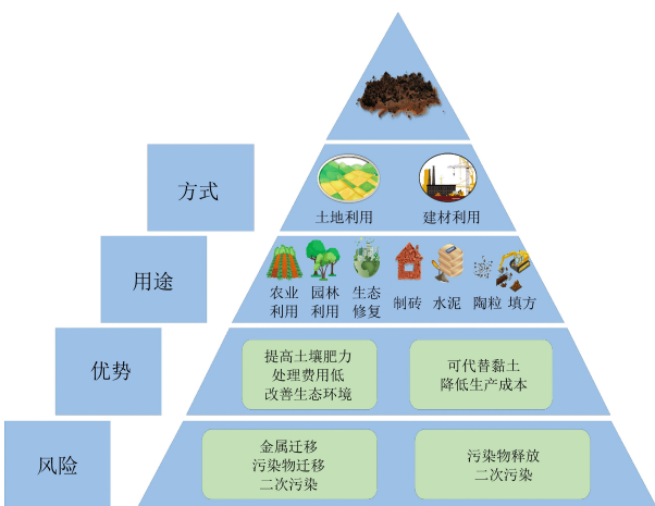
图1 清淤底泥的资源化利用方式

水库底泥以半固态和不溶性固体形式存在,研究发现,底泥中含有丰富的碳和其他元素,且性质接近黏土,底泥的颗粒较细,是一种很有应用前景的建筑材料、生物炭原料、填方材料和污水净化材料等 [14-19] 。例如,Zhou 等 [14] 提出了直接利用污泥制备瓦片的方法,将污泥直接掺入间歇式混合料中,不进行热动力干燥等预处理,经湿法球磨、压滤、碾磨、挤压成型、干燥、烧制得到劈裂砖,并进行了一系列实验和理化表征,结果表明:添加污泥的最大含量高达 60% (质量分数);1 210 °C 焙烧的劈裂瓦片的抗弯强度和吸水率分别为 25.5 MPa 和 1.14% (质量分数);并且样品具有良好的环境相容性。因此,利用底泥生产劈裂砖的工业应用将有助于显著减少底泥累积对环境的影响。利用底泥还可以制作陶粒材料,例如,梁标等 [15] 探究了将底泥烧制成陶瓷的工艺参数以及应用,为底泥应用于制陶工艺提供了思路。Maherzi 等 [16] 还将收集的底泥沉积物和疏浚砂的混合物用道路液压粘合剂处理。按照法国石灰和/或水硬性粘合剂土壤处理技术指南的建议制备配方并进行表征,发现两种水硬性粘合剂的机械阻力结果非常相似,在扫描电子显微镜分析中观察到,两种水硬性粘合剂都会导致道路材料膨胀,这一方面受到钙矾石数量的影响,另一方面受到孔隙材料中含水量的影响。